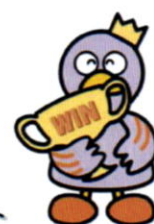
埼玉県の マスコット 「コバトン」